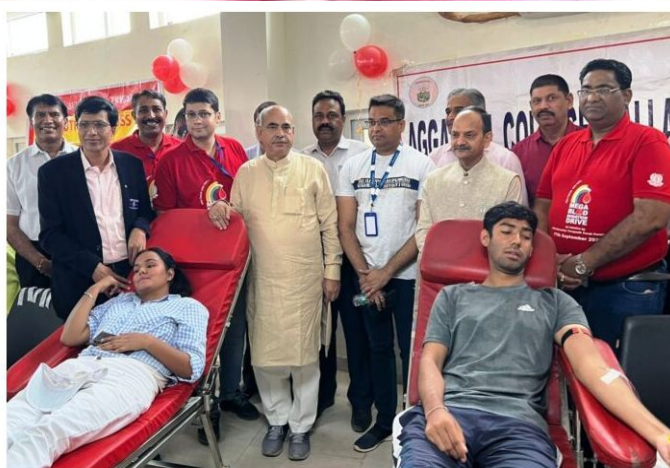
फरीदाबाद, जनतंत्र टुडे