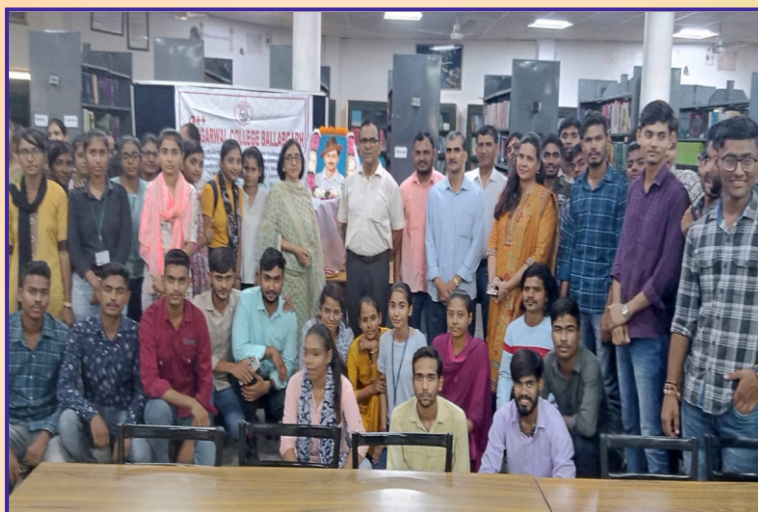
Celebrations of Shashad Bhagat Singh Jayanti