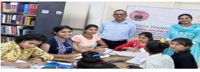
फरीदाबाद, जनतंत्र दृष्टे