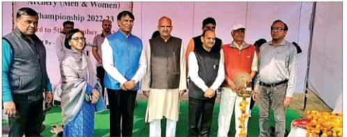
सोप प्रजापति करने के उपरांत सभी एक साथ।